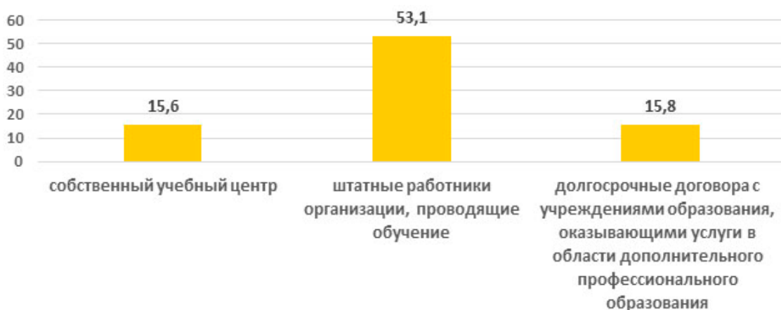
Рисунок 2 – Распределение мнений респондентов о наличии условий и базы для организации внутрифирменного обучения, %

Для респондентов значимым представляется условие наличия договоров с центрами и организациями, предоставляющими услуги дополнительного профессионального образования. Незначимыми оказались условия, связанные с формальными и неформальными отношениями по поводу организации обучения с учреждениями профессионального, специального и высшего