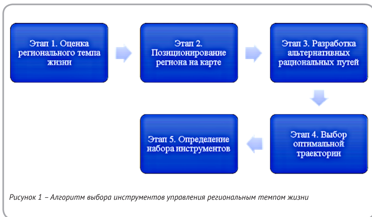
Рисунок 1 – Алгоритм выбора инструментов управления региональным темпом жизни

нального темпа жизни представляет собой интеграцию частных критериев, выделенных из исходного множества показателей интенсивности физического и информационного потоков. Сформированный набор показателей включает: количество пассажирских мест и коек внутрирегионального транспорта в расчете на душу населения; пассажирооборот внутреннего транспорта в расчете на душу населения; количество автотранспорта в расчете на душу населения; доля площади городских земель; плотность дорог на км^2 ; конечное потребление электроэнергии транспортным сектором в расчете на душу населения; доля общей площади застройки; трафик телефонных разговоров в расчете на душу населения; количество аэропортов в расчете на душу населения; конечное потребление электроэнергии в расчете на душу населения; поставки моторного топлива в расчете на душу населения; трафик дорожного движения; доля населения с ежедневным выходом в интернет; конечное потребление электроэнергии в жилых домах в расчете на душу населения; количество мобильных абонентов в расчете на душу населения; количество телефонных линий в расчете на душу населения; количество интернет-пользователей в расчете на душу населения; доля лиц исполь-