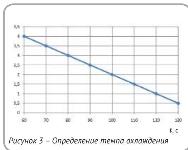
Рисунок 3 – Определение темпа охлаждения

По логарифмированной линейной модели определяется темп охлаждения для двух произвольных значений времени (рисунок 3).