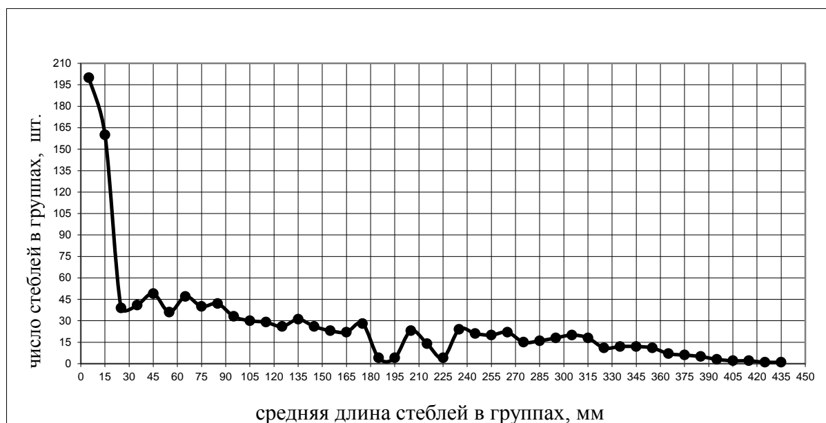
Рисунок 2 – Распределение стеблей по их количеству в отдельных группах

Результаты экспериментальных данных были обработаны в программе Microsoft Excel, с помощью которой были построены диаграммы распределения стеблей по длине в группах с учетом их количества, технической длины, диаметра, массы, а также диаграмма распределения волокон по длине, которые представлены на рис. 2 – 6.