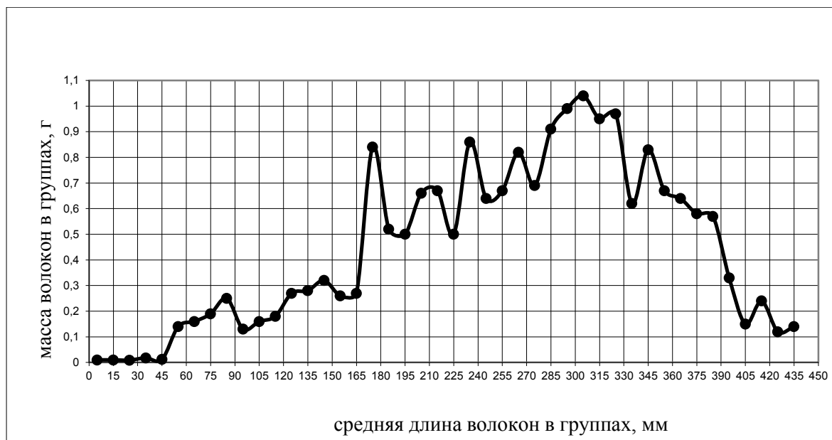
Рисунок 6 – Диаграмма распределения волокон по длине