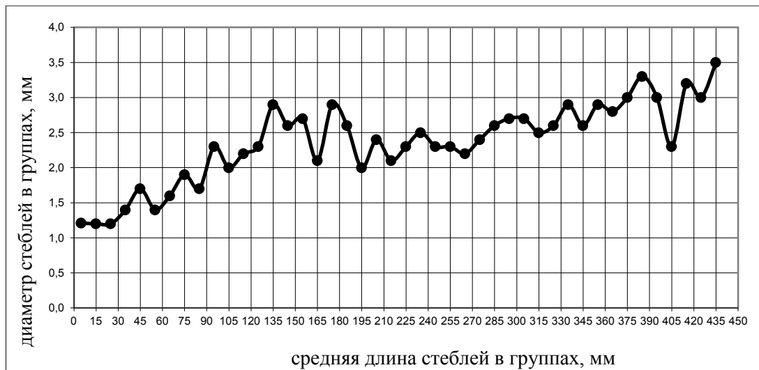
Рисунок 4 – Распределение стеблей разной толщины по группам длин