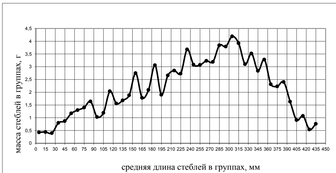
Рисунок 5 – Диаграмма распределения стеблей разной массы по группам длин