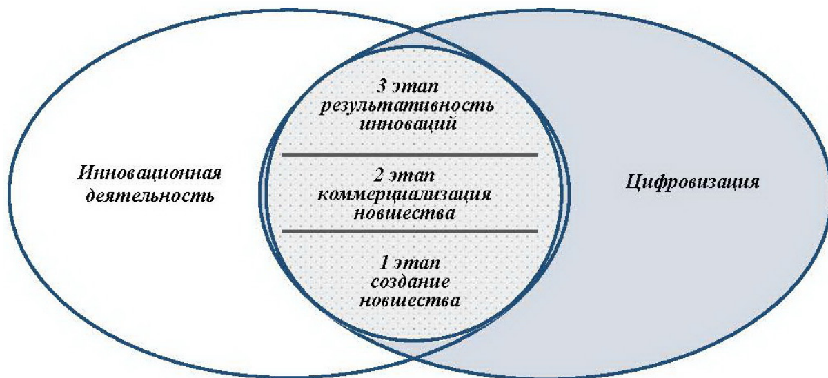
Рисунок 3 – Взаимосвязь инновационной деятельности и цифровых трансформаций в организации Figure 3 – The relationship between innovation and digital transformations in an organization