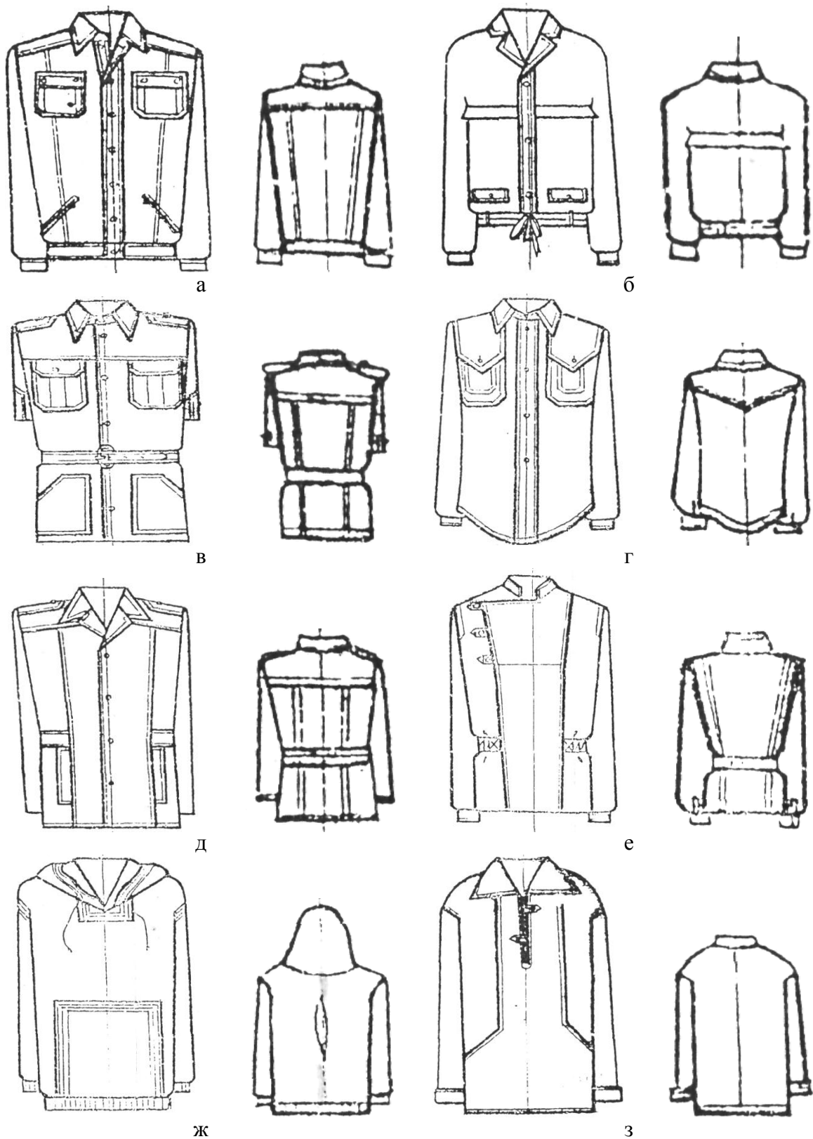
Рисунок 1 – Разновидности курток: а – обычная; б – блузон; в – куртка-сафари; г – куртка-рубашка; д – куртка-пиджак; е – куртка-ветровка; ж – анорак; з – куртка-роба

Куртка «обычная» появилась в начале XX века в связи с развитием спорта, велосипедного и автомобильного транспорта. Она сохранилась до настоящего времени, не претерпев существенных изменений. Ее форма и конструктивно-композиционное построение деталей воспринимаются как повседневные, обычные в нашей жизни. Куртки «обычные» чаще всего с втачным или рубашечным рукавом, прямого или полуприлегающего силуэта. Перед и спинка обычно с кокетками и различными