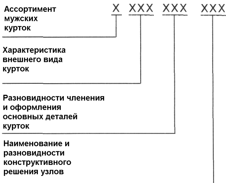
Рисунок 4 – Классификатор ассортимента, внешнего вида и конструктивно-композиционного построения деталей и узлов мужских курток

Проведенная систематизация разновидностей мужских курток позволила выявить классификационные признаки, по которым проведено разделение изделий на классы, группы и виды. Для более конкретной характеристики формы и конструкции выделенных разновидностей курток разработан классификатор ассортимента летних мужских курток по признакам внешнего вида и конструктивно–композиционного построения деталей и узлов. При разработке классификатора использован иерархический метод классификации и цифровое кодирование. Длина кода – десять цифровых десятичных знаков. Укрупненная структура кода представлена на рисунке 4.