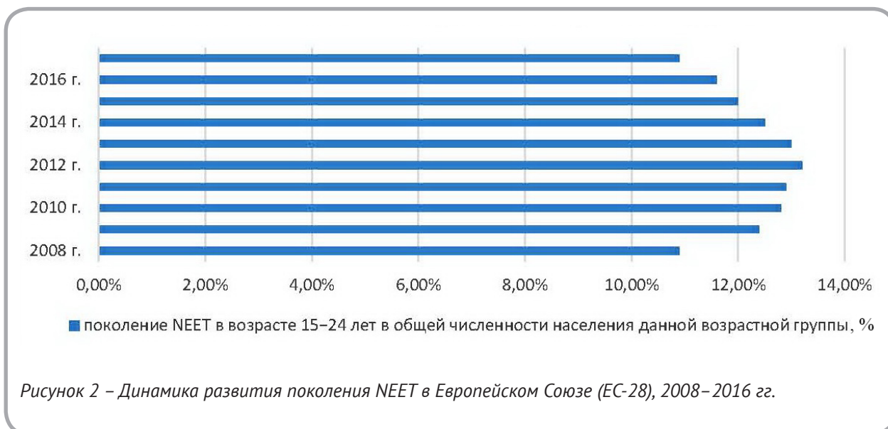
Рисунок 2 – Динамика развития поколения NEET в Европейском Союзе (ЕС-28), 2008–2016 гг.

В Республике Беларусь субъекты социального предпринимательства не выделены в отдельный сектор экономики. Для получения объективного